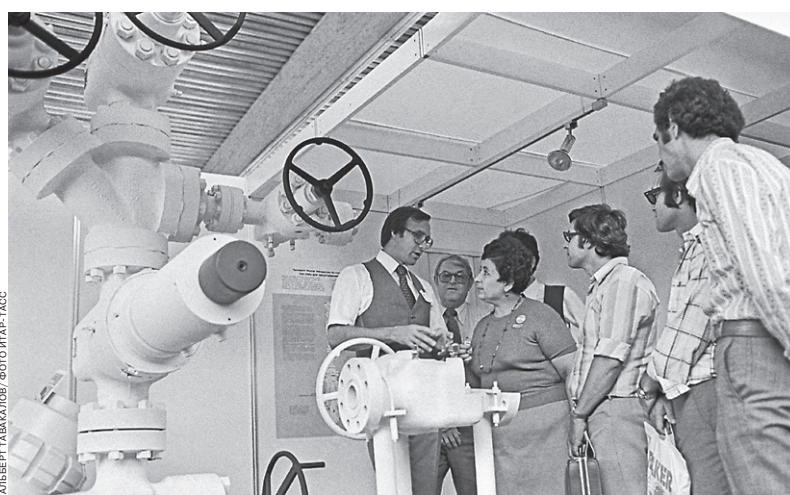
Выставка «Нефтегаз» уже более 35 лет собирает лучшие компании и выдающихся экспертов со всего мира. На одном из стендов бакинской премьеры выставки в 1978 году (слева)

Среди постоянных участников выставки: компании China Petroleum Technology and Development (Китай), Man Turbo (Германия), Møkvelde Valves BV (Нидерланды), Kanex Krohne (Германия), R and B Industrial Supply (США), Siemens (Германия), VNG-Verbundnetz Gas AG (Германия), Wingas (Германия), транснациональная компания ABB и другие мировые лидеры. Из российских традиционных участников можно назвать: ОАО «Газпром», «Газпром нефть», «Зарубежнефть», ХК «Интра Тул», АК «Транснефть», «Татнефть», Трубная метал-